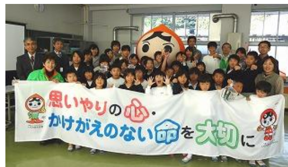
各学級で大切に育てていきたいと思ひます。

11月14日(水)に「人権の花」贈呈式を行いました。人権擁護委員の方とマスコットの「まもるくん」に来ていただきました。これは人権尊重の精神を身につけることを目的としています。「紙芝居」と「DVD」を視聴した後、学級に2つずつ「人権の花=ヒヤシンスの球根」をいただきました。各学級で大切に育てていきたいと思います。